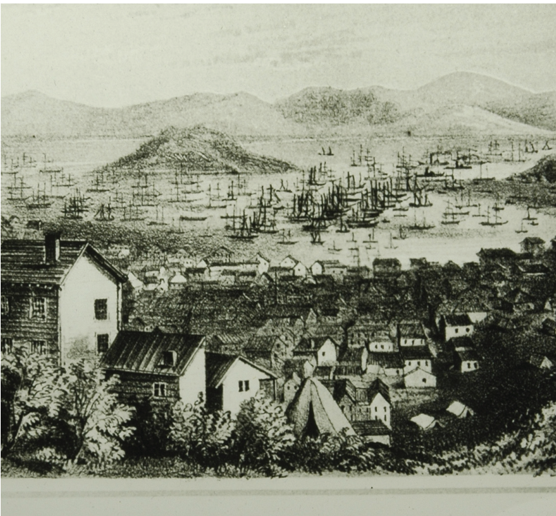
San Francisco, California, noviembre 1849

Ya sea que viajaran a California caminando, en vagones cubiertos o en botes, una vez que llegaban a estas ciudades, la gente necesitaba comprar alimentos, suministros, y otros artículos. Muchas negocios nuevas comenzaron a proporcionar productos (artículos para la venta) y servicios (actividades para la venta que ayudan a otras personas) a las personas que vivían en California. Todavía existen varias de las empresas que comenzaron durante la Fiebre del oro de California, como los jeans Levi's y el banco Wells Fargo. A medida que cada vez se encontró menos oro, la gente comenzó a abandonar estas ciudades. Algunas ciudades de crecimiento rápido se convirtieron rápidamente en pueblos "fantasmas" (pueblos abandonados), mientras que otras, como San Francisco y Sacramento, siguen siendo ciudades grandes en la actualidad. Al final, muy pocos mineros de oro se enriquecieron con este oro. Las personas que ganaron mucho dinero durante la Fiebre del oro de California fueron las personas que vendieron diferentes productos y servicios a los mineros de oro.