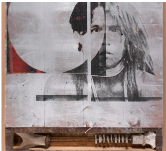
Técnica mixta: una obra de arte que incorpora más de un tipo de medio