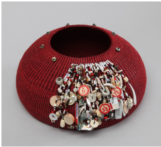
Canasta: una obra de arte en 3D creada al tejer juntos plantas y a veces otros materiales

INTRODUCCION – El Museo Autry del Oeste Americano es un museo que se encuentra ubicado en Griffith Park en Los Ángeles, California. El Museo Autry ofrece muchos tipos diferentes de exposiciones, como la exposición y venta de arte del Masters (maestros/maestras) del oeste americano . Esta exposición anual muestra obras de arte realizadas por artistas contemporáneos que cuentan historias sobre los diversos pueblos, animales, plantas y paisajes del oeste americano. Las obras de arte de esta exposición se pueden ver y comprar. Las obras de arte vienen en muchas formas. Obtén más información sobre algunos de los diversos tipos de obras de arte mirando las imágenes del Museo Autry y leyendo sus descripciones.