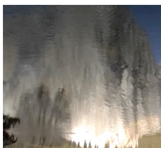
Video: una grabación de imágenes visuales que pueden incluir audio