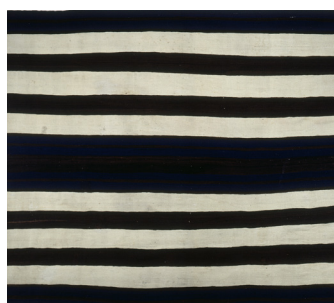
Textil: una obra de arte tejida como una tela