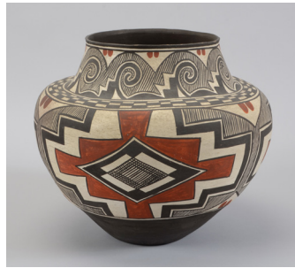
Cerámica: una obra de arte en 3D hecha de un material como arcilla que se endurece con el calor