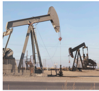
Fotografía: una imagen 2D de algo tomada con una cámara