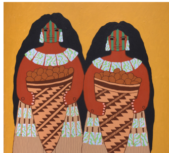
Pintura: una imagen 2D de algo que utiliza pintura