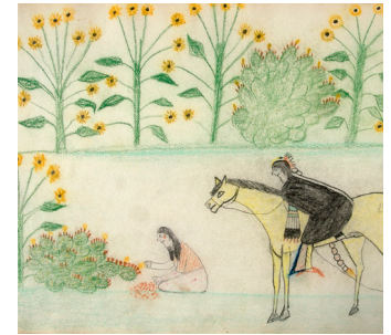
Dibujo: una imagen en 2D de algo utilizando tiza, crayones, marcadores, lápices o bolígrafos