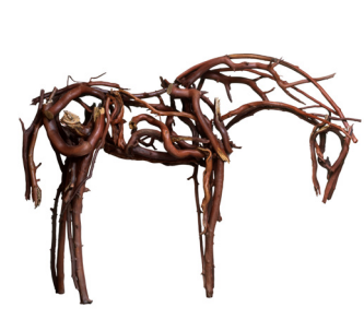
Escultura: una obra de arte en 3D hecha de materiales que se utilizan de una manera interesante