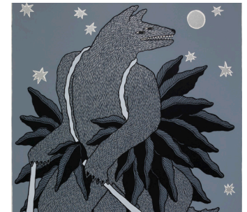
Impresión: una obra de arte en 2D creada copiando a otro material una imagen de una superficie con tinta