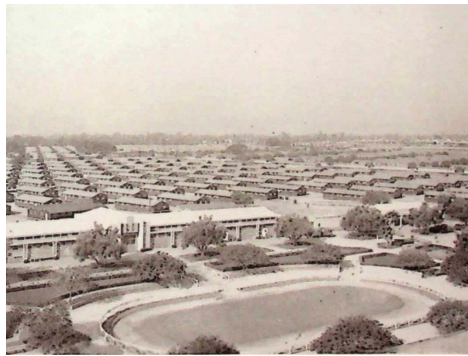
Una parte del Centro completo de asambleas de Santa Anita (California), situado dentro del mundialmente famoso hipódromo de Arcadia, California. Este fue el más grande de todos los Centros de Asamblea. Cerca de 19.000 personas se alojaron aquí.