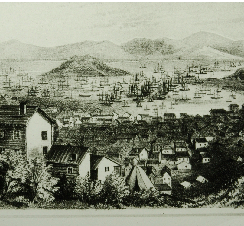
San Francisco, California, noviembre 1849

Ya sea que viajaran a California caminando, en vagones cubiertos o en botes, una vez que llegaban a estas ciudades, la gente necesitaba comprar alimentos, suministros, y otros artículos. Muchas negocios nuevas comenzaron a proporcionar productos (artículos para la venta) y servicios (actividades para la venta que ayudan a otras personas) a las personas que vivían en California. Todavía existen varias de las empresas que comenzaron durante la Fiebre del oro de California, como los jeans Levi's y el banco Wells Fargo. A medida que cada vez se encontró menos oro, la gente comenzó a abandonar estas ciudades. Algunas ciudades de crecimiento rápido se convirtieron rápidamente en pueblos "fantasmas" (pueblos abandonados), mientras que otras, como San Francisco y Sacramento, siguen siendo ciudades grandes en la actualidad. Al final, muy pocos mineros de oro se enriquecieron con este oro. Las personas que ganaron mucho dinero durante la Fiebre del oro de California fueron las personas que vendieron diferentes productos y servicios a los mineros de oro.