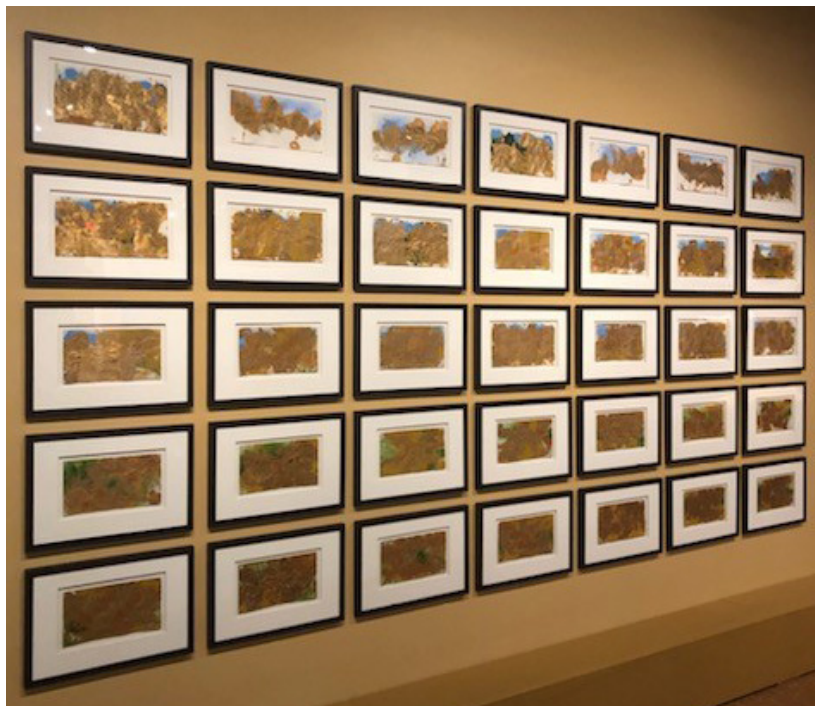
Una serie de pinturas del Museo Autry del Oeste Americano

1ª PARTE – Crear arte es una forma de activismo. A lo largo de la historia, los artistas han creado arte como una forma de activismo. A través de su arte los artistas pueden educar a otras personas sobre los diferentes problemas sociales que afectan a las comunidades. Analicemos (estudiemos) el arte que incorpora activismo dándose cuenta de las comunidades y de los problemas sociales que se encuentran representados en el arte. Tómese un momento para mirar de cerca esta serie de pinturas (una serie de cosas similares que suceden una tras la otra) del Museo Autry del Oeste Americano. Luego mire las tres pinturas individuales de la serie de pinturas.