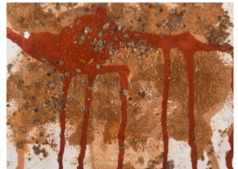
Tres pinturas individuales de la serie de pinturas