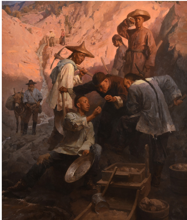
La pepita de oro, campamento chino 1850 por Mian Situ

A continuación mira de cerca la obra de arte. Muestra a los mineros de oro chinos mirando una pepita de oro mientras otros hombres miran en la distancia. Encuentra algunas pistas (por ejemplo, herramientas) que demuestren que estos hombres son mineros de oro. Luego, dibuja un círculo alrededor de estas pistas en la obra de arte.