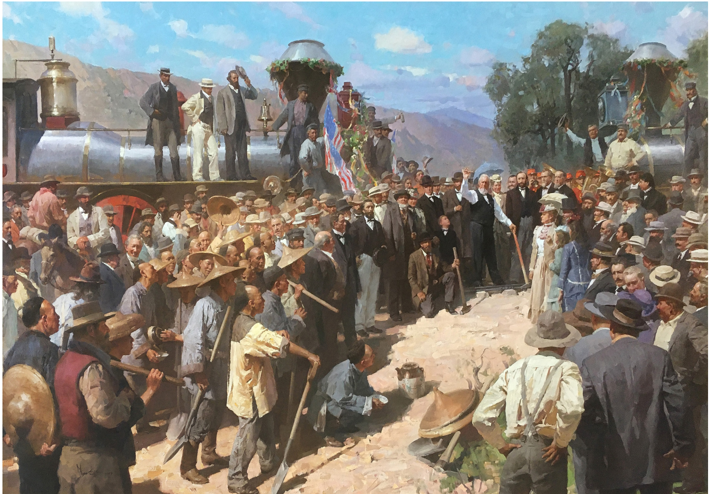
Obra de arte #2