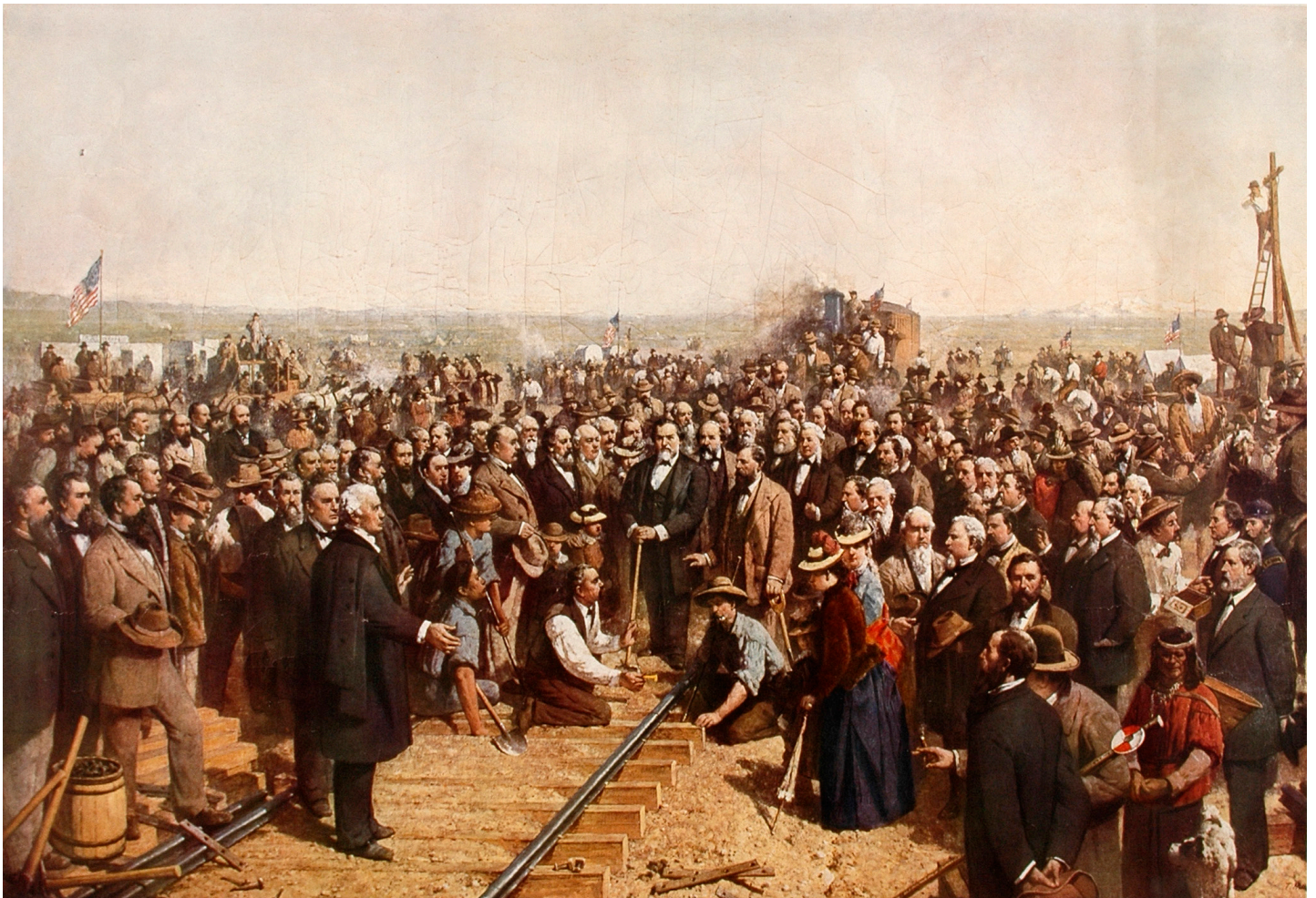
Obra de arte nº 1

La obra de arte nº 1 también es del Museo Autry. Tómate un momento para mirar de cerca la ilustración nº 1 a continuación.