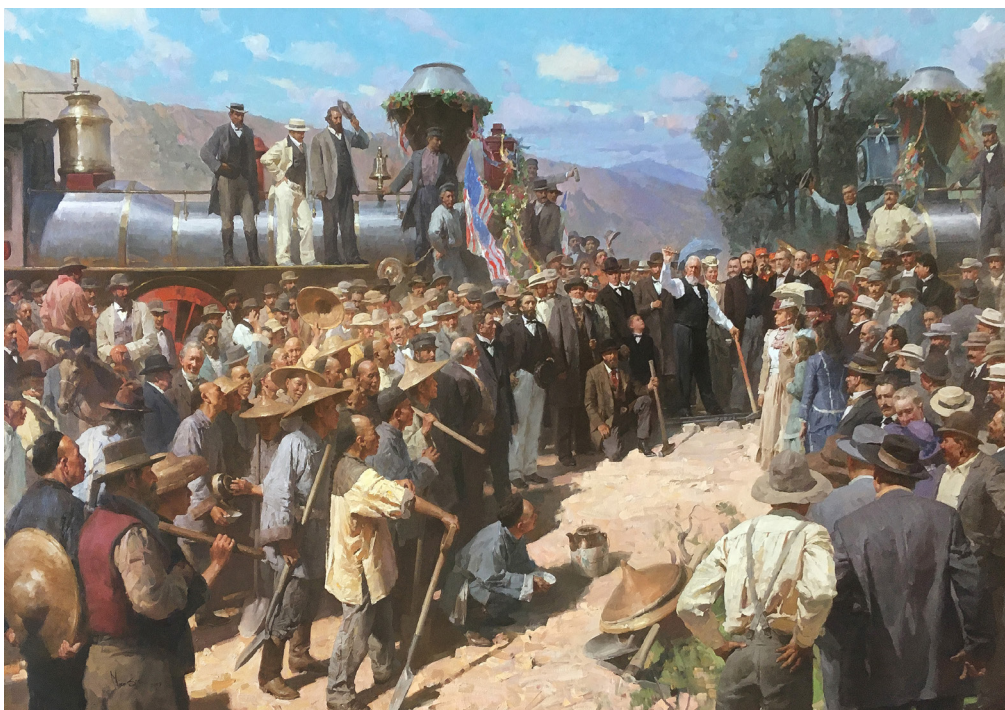
Obra de arte #2